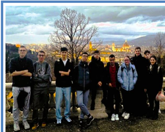
foto ricordo da Firenze